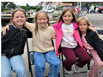
Simskolebarnen: fr vänster.